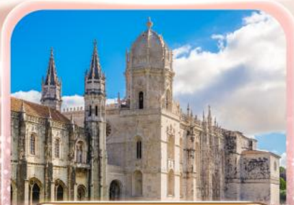
มหาวิหารเจโรนิโม