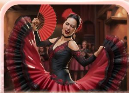
ระบำฟลามิงโก