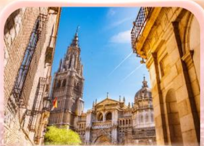
มหาวิหารแห่งโทเลโด