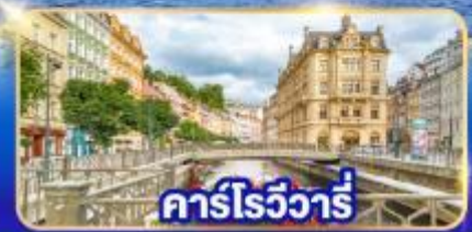
คาร์โรวัวร์