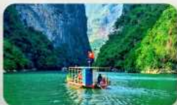
ล่องเรือ Ma Pi Leng Pass

YEN BIEN LUXURY 4* หรือเทียบเท่ามาตรฐานเวียดนาม