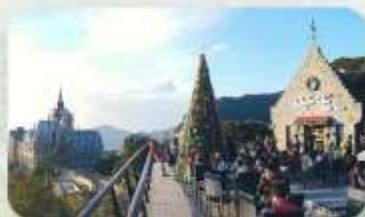
Gio Cafe Tam Dao