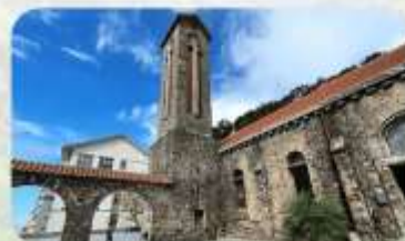
Tam Dao Stone Church