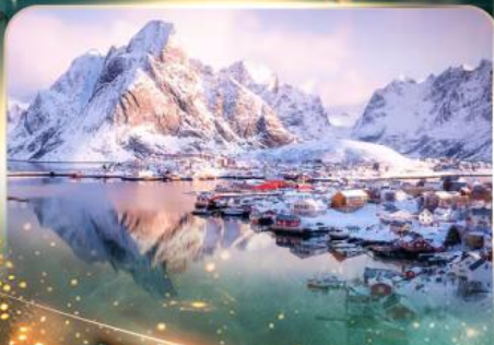
หมู่บ้านเรนเน