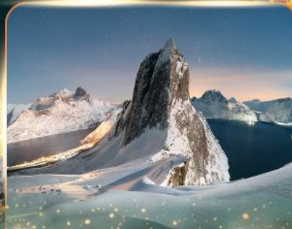
เกาะเซนญา