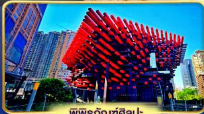
พิพิธภัณฑ์ศิลปะ