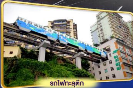
รถไฟฟ้าลูตึก