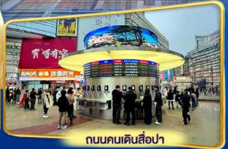
ถนนคนเดินสี่ป่า