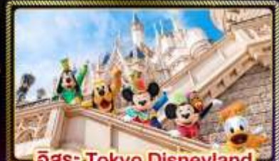
อิสระ Tokyo Disneyland