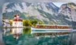
ทะเลสาบโคนิกซ์