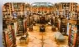
หอสมุดมรดกโลก St.Gallen