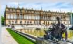
พระราชวัง Herrenchiemsee