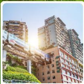
รถไฟฟ้าสุดึก