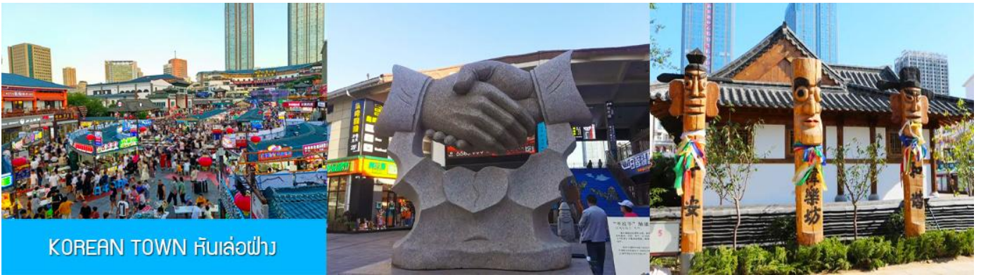
KOREAN TOWN หันเล่อฝาง

จากนั้นนำท่านสู่ ย่านเกาหลี KOREAN TOWN หันเล่อฝาง 韩乐坊 แหล่งท่องเที่ยวระดับ 3A ที่ชุกชุมเต็มไปด้วยวัฒนธรรมเกาหลีของเมืองเว이하ี ประกอบด้วยถนนคนเดินเกาหลี ประตุน้ำที่สวย หอเฉลิมฉลอง และจัตุรัสวัฒนธรรมเล่อเทียนที่มีความโดดเด่นด้านสถาปัตยกรรม ให้ท่านได้เดินชม เก็บภาพ ลิ้มรสอาหารพื้นเมืองในย่านเกาหลีได้อย่างเต็มอิ่ม..