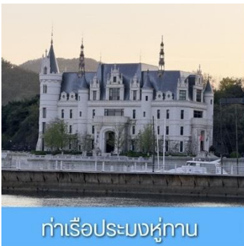
ท่าเรือประมงหู่กาน

พักที่ DALIAN JUZISHUIJING HOTEL / SANSHUI HOTEL โรงแรมระดับ 4 ดาวท้องถิ่น ต้าเหลียน