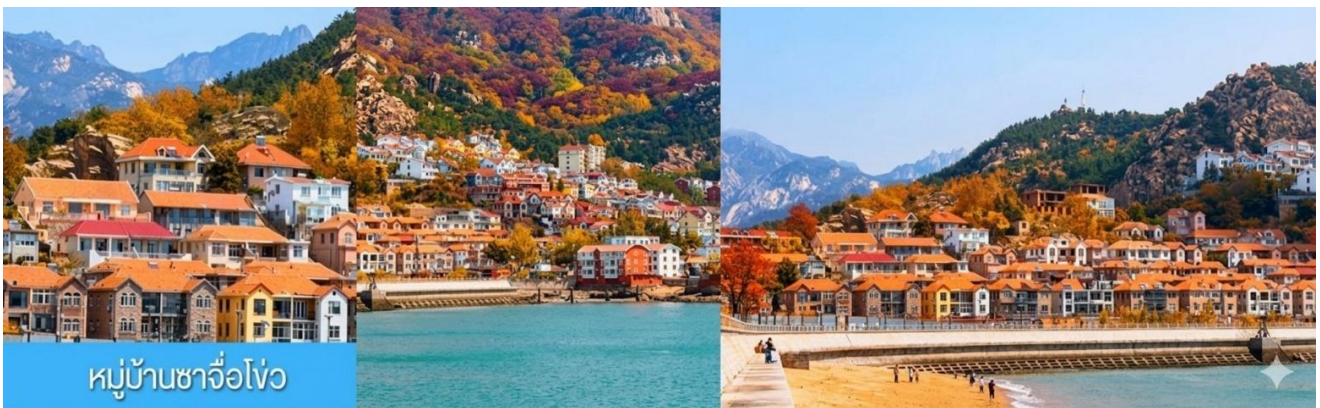
หมู่บ้านซาจื่อโ้ว

พักที่ WEIHAI BOYUE HOTEL / WEIHAI JIANGUO PUYIN โรงแรมระดับ 4 ดาวท้องถิ่นเมืองเว이하ี