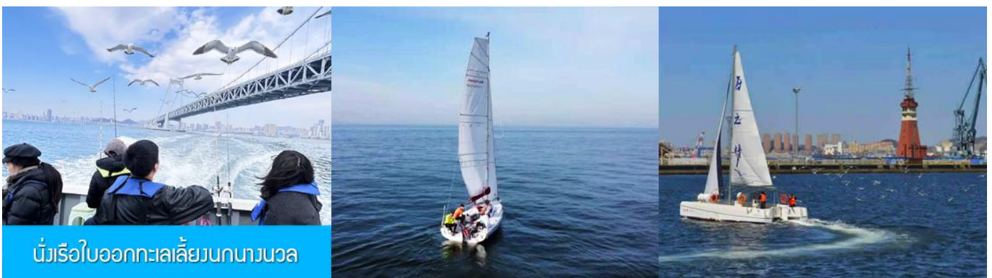
นั่งเรือใบออกทะเลลิ้นบกนางนวล