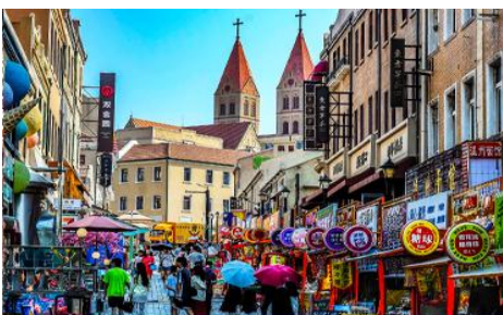
ถนนวงเวียน