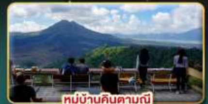
หมู่บ้านคินตามณี