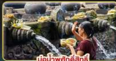
บ่อน้ำพุศักดิ์สิทธิ์