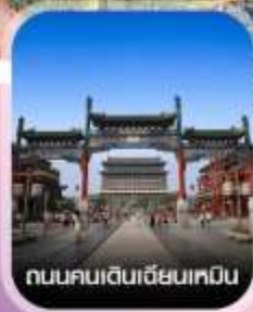
ถนนคนเดินเฉียนเหมิน

✈️ คอนเฟิร์มออกเดินทาง ทุกพีเรียด 2 ท่านขึ้นไป