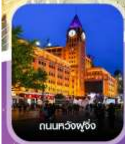
ถนนทวิงฟู่จิ่ง