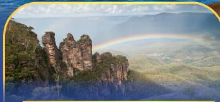
อุทยานแห่งชาติลูมาบีเก็นส์ Three Sister Rock