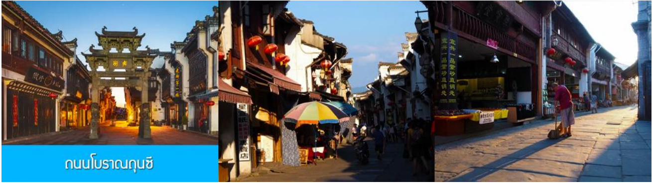
ถนนโบราณกุ๋นซี

นำท่านเที่ยวชม ถนนโบราณกุ๋นซี 屯溪老街 ถนนที่เป็นย่านการค้าโบราณในยุคราชวงศ์ซ่งซึ่งได้อายุกว่า 700 ปี ถนนมีความยาวราว 1272 เมตร สองฝั่งถนนมีอาคารบ้านเรือนโบราณสไตล์หุยโจวที่สร้างในยุคปลายราชวงศ์หมิงและราชวงศ์ชิงที่ถูกอนุรักษ์ไว้เป็นอย่างดี ปัจจุบันยังมีห้างร้าน โบราณ อาทิ ร้านขายโบราณวัตถุ ร้านขายหยก ร้านขายภาพเขียนและอักษรพู่กันโบราณ ร้านอาหารพื้นเมือง ร้านขายของที่ระลึก ฯลฯ นอกจากนี้ร้านค้าและอาคารบ้านเรือน โบราณที่นี้ยังเป็นแหล่งรวมของนักท่องเที่ยวที่มาชิมอาหารพื้นเมือง เดินช้อปปิ้งและถ่ายภาพ เช็किन