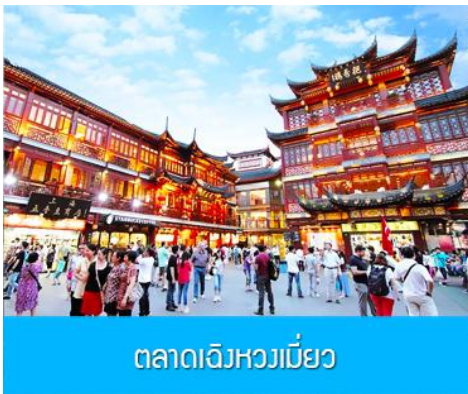
ตลาดเจิงหวงเมี่ยว

เช้า รับประทานอาหารเช้า ณ ห้องอาหารของโรงแรม (6)