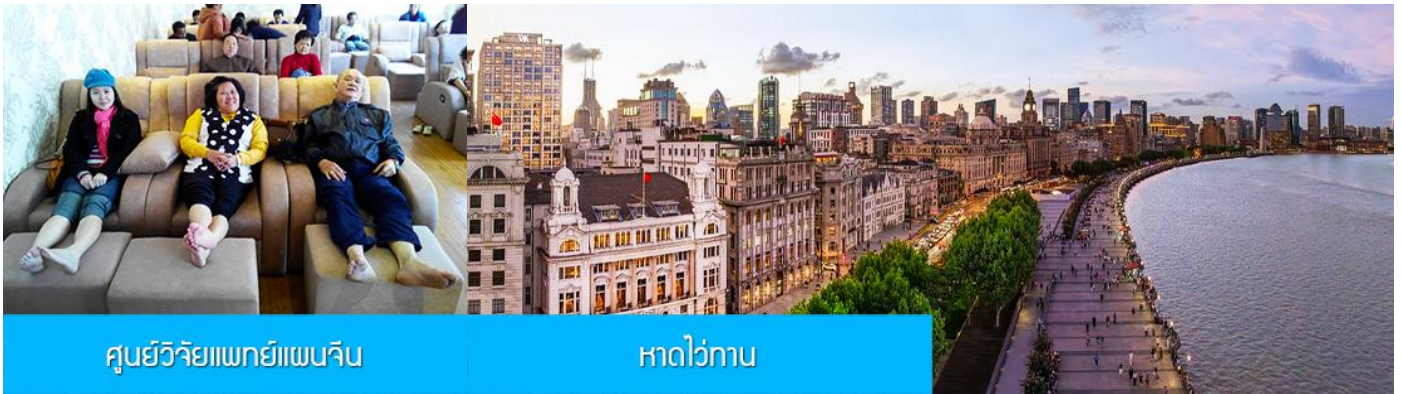
ศูนย์วิจัยแพทยแผนจีน