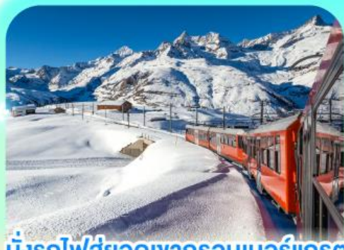
นั่งรถไฟสู่ออดเขากรอนเนอร์เกรต