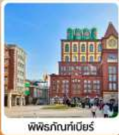
พิพิธภัณฑ์เบียร์