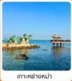
เกาะหย่างหม่า