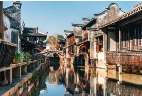
เมืองโบราณวูเจิน