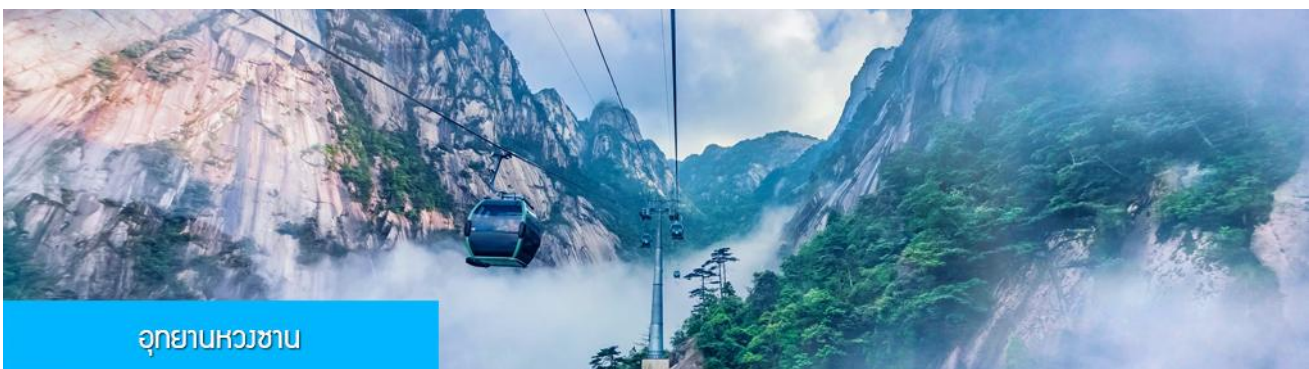
อุทยานหวงซาน