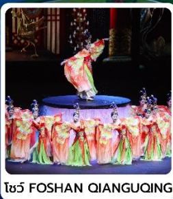
โชว์ FOSHAN QIANGQING