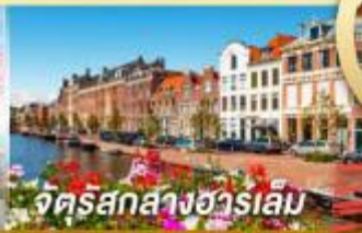
จัตุรัสกลางฮาร์เลม