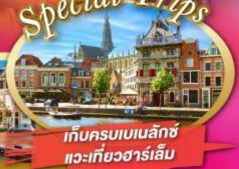
เก็บครบเบเนลักซ์ แวะเที่ยวฮาร์เลม