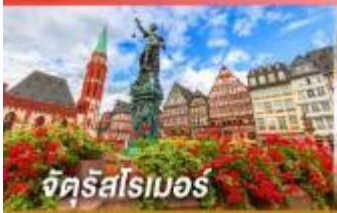
จัตุรัสโรเมอร์