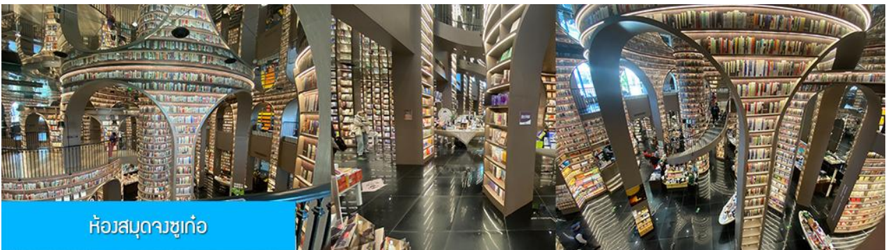
ห้องสมุดวงจุก่อ

พักที่ โรงแรม MINGZHISHANGCHUN HOTEL ระดับ 4 ดาวท้องถิ่นหรือเทียบเท่าในเมืองคูเจียงเวียน