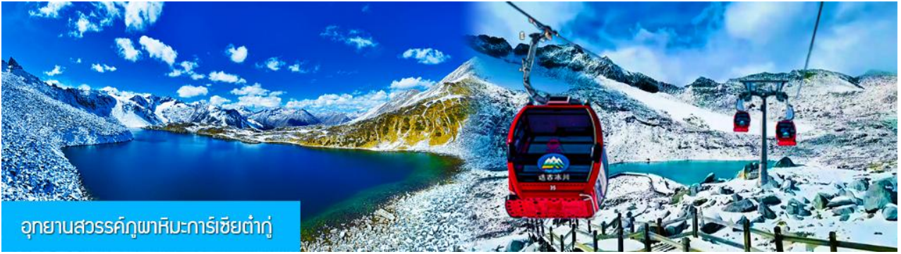
อุทยานสวรรค์กุมาหิมะการ์เซียต้ากู่