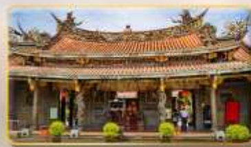
วัดต้าหลงคงเป่าอัน