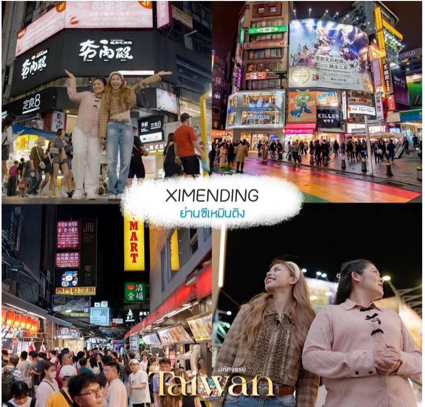
XIMENDING ย่านซีเหมินติง

คำ ๑๐ อีสรอาหารค่ำตามอัยาศัย ณ ตลาดซีเหมินติง ไนท์มาร์เก็ต จากนั้น นำท่านเข้าพักที่ เมืองไทเป 3*หรือเทียบเท่าตามมาตรฐานได้ทุกวัน (โรงแรมที่ระบุในรายการทัวร์เป็นเพียงโรงแรมที่นำเสนอเบื้องต้นเท่านั้น ซึ่งอาจมีการเปลี่ยนแปลงแต่โรงแรมที่เข้าพักจะเป็นโรงแรมระดับเทียบเท่ากัน)