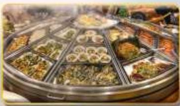
หม้อนึ่งจักรพรรดิ