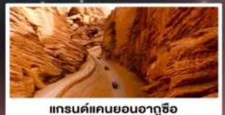
แกรนด์แคนยอนอาถูซือ