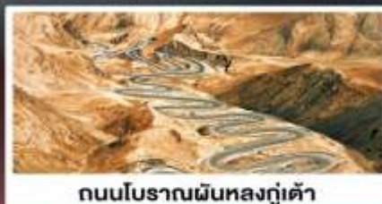
ถนนโบราณผืนหลงกู่เต้า