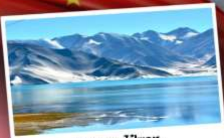
ทะเลสาบไปซาทุ

เปิดประตูสู่อารยธรรมพันปีแห่งซินเจียงใต้ ชมความสวยงามของหมู่บ้านดอกแอปเปิ้ล