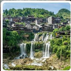
ฝูหลงเจิน