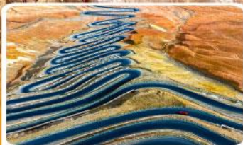
ถนนผานหลงกู่ต้าอว