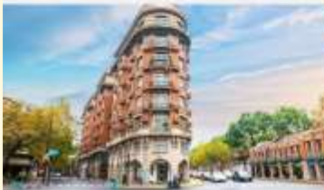
ถนนอู่คัง