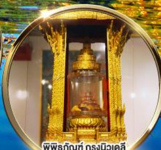
พิพิธภัณฑ์ กรุงนิวเดลี กราบมัสการพระบรมสารีริกธาตุ