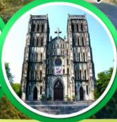
โบสถ์เซนต์โจเซฟ