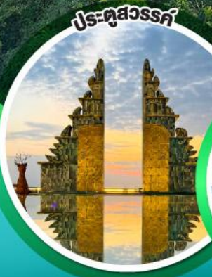
ประตูลสวรรค์