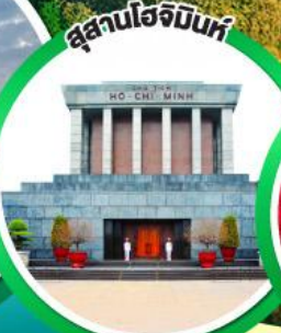
สุสานโฮจิมินห์