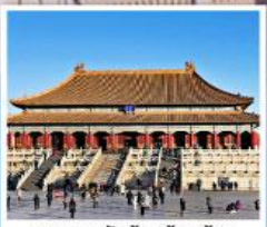
พระราชวังต้องห้ามปักกิ่ง