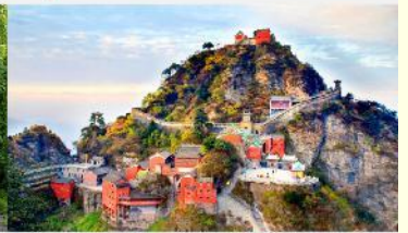
อุทยานเขาวู้ต้ง

*ทางบริษัทฯ ขอสงวนสิทธิ์ในการสลับโปรแกรมทัวร์ตามความเหมาะสมขึ้นอยู่กับสถานการณ์หน้างาน โดยคำนึงถึงผลประโยชน์ของลูกค้าเป็นสำคัญ