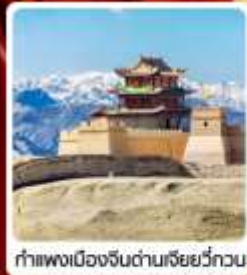
กำแพงเมืองจีนด่านเสี่ยววีกวน

• ไซโล่...เส้นทางสายไหม ชมสระบัววังพระจันทร์ ทะเลทรายหมีงาช้าง กำแพงเมืองจีนด่านสุดท้าย "เจียวีกวน" มรดกโลกภูเขาสายรุ้งจางเย่