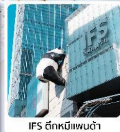
IFS ตึกหมีแพนด้า

● ไอโกล์ นั่งกระเช้าขึ้นชมกุเขาสิมะวาวู๋ ซื้อมบิงกอนนซุนซีลู่ แลนด์มาร์คแพนด้ายักษ์เป็นตึก IFS เจิงตู