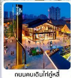
ถนนคนเดินไท่กุ๋หลี่