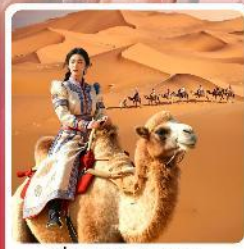
ขี่อูฐชมทะเลทราย

• ไอโอล์ก ชมความงามอุทยานหุบเขาคลิ้น มรดกโลกภูเขาสายรุ้ง ตามรอยวิถีชีวิต และพิภพระเืองของชาวมองโกเลีย