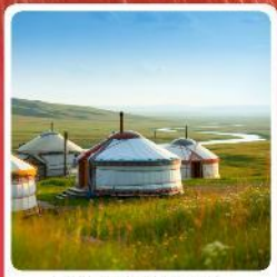
ทุ่งหญ้าออร์ดอส