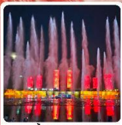
น้ำพุคังปาสือ