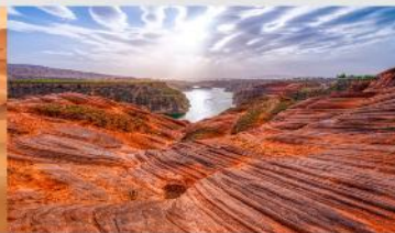
อุทยานหุบเขาคีลิน

*ทางบริษัทฯ ขอสงวนสิทธิ์ในการสลับโปรแกรมทัวร์ตามความเหมาะสมขึ้นอยู่กับสถานการณ์หน้างาน โดยคำนึงถึงผลประโยชน์ของลูกค้าเป็นสำคัญ