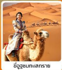
ขี่อูฐชมทะเลทราย