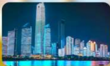
หาดไซเบอร์ฟังก์