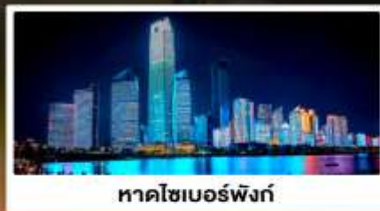
หาดไซเบอร์พิงก์