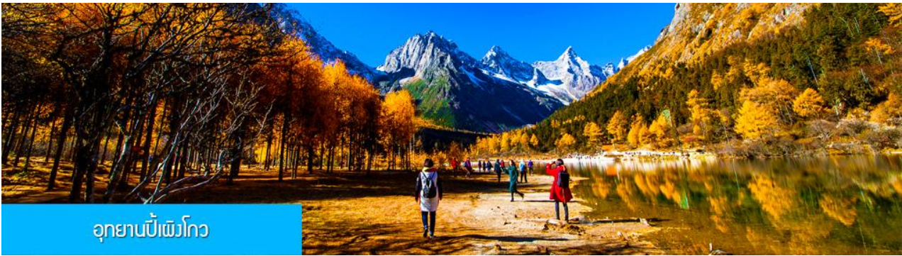
อุทยานปีเพิงโกว