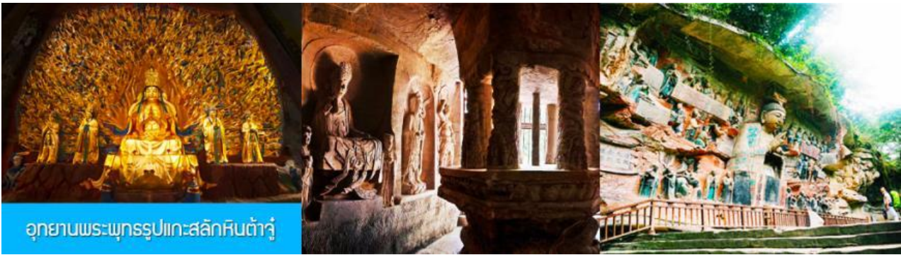
อุทยานพระพุทธรูปแกะสลักหินต้าจู่