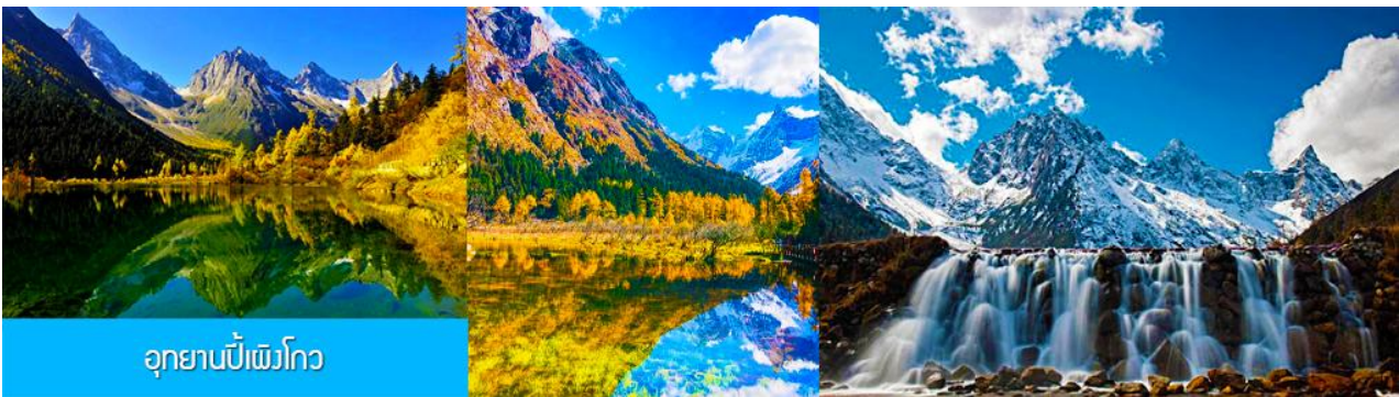
อุทยานปีเพิงโกว