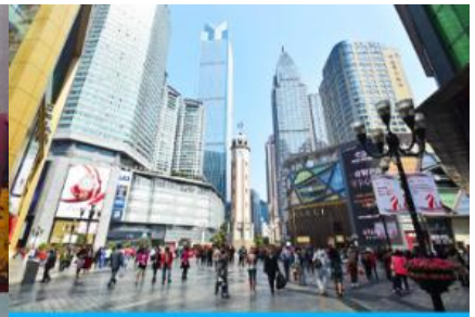
ย่านเจียฟางเปย