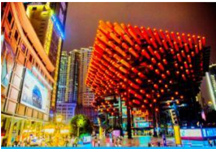
หอศิลป์กั๋วไท่