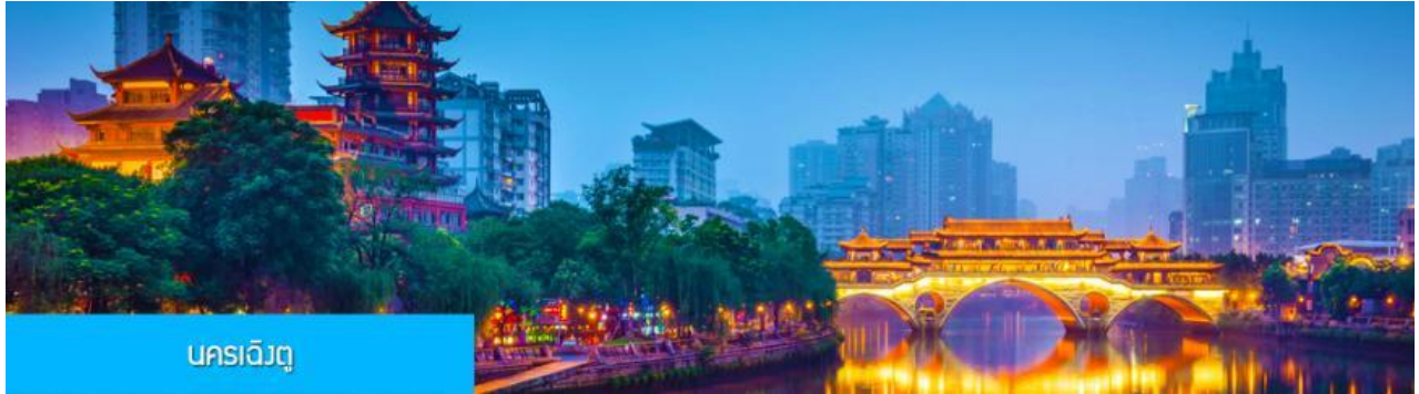
นครเจียงตู