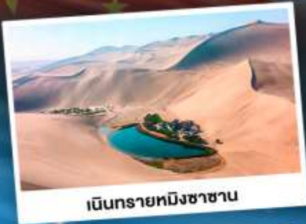
เนินทรายหมิงซาซาน