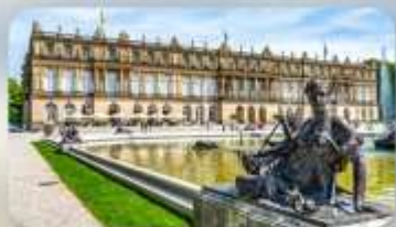
พระราชวัง Herrenchiemsee