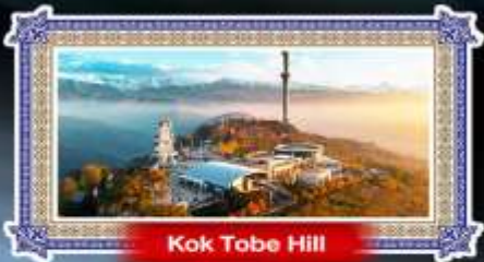
Kok Tobe Hill