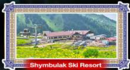
Shymbulak Ski Resort