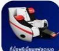
ที่นั่งพรีเมียมเฟลทเบด

บริการอาหารร้อน และ น้ำดื่ม บนเครื่อง ขาไป และ ขากลับ