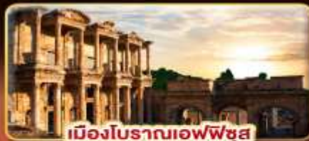
เมืองโบราณเอเฟซุส