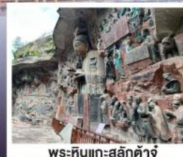
พระหินแกะสลักตัวจู้