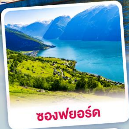
ช่องฟยอร์ด