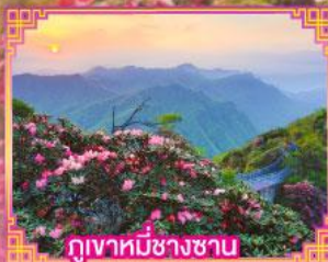
ภูเขาหมีช้างซาน