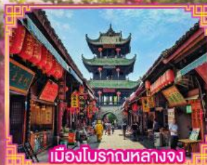
เมืองโบราณหลางจง